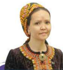
Rus dilinden terjime eden Orazgöl GURBANOWA